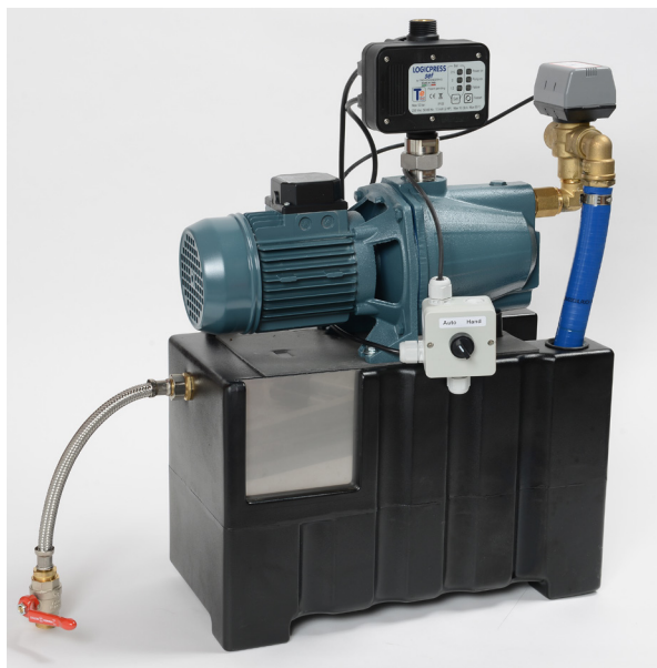
Ensemble complet livré prêt à être raccordé