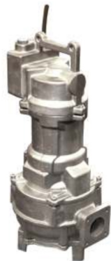
Version inox 316L