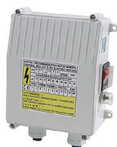
Coffret de démarrage extérieur pour pompe monophasée fourni