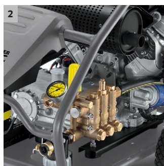
2 Réglage de la vitesse de rotation