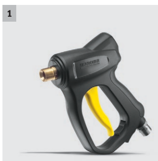
1 Pistolet industriel