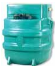
POLYFOS / AEROPOLYFOS