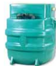
POLYFOS / AEROPOLYFOS