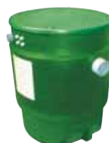
MONOFOS 400 DOUBLE