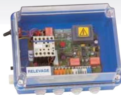
PROTEC 2 Relevage