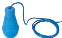
IFB Régulateur de niveau