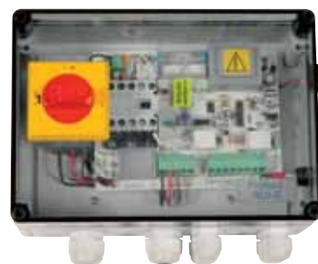
PROTEC 2 RLV-S