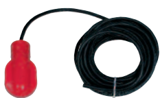
MICROSTART Interrupteur de niveau Code : 471110