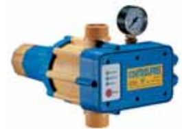
CONTROLPRES pour puissance jusqu'à 2,2 kW. Régulation de la pression de sortie entre 3 et 6,5 bars.