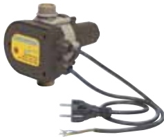
ECOCONTROL pour puissance jusqu'à 1,1 kW