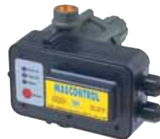
MASCONTROL pour puissance jusqu'à 2,2 kW