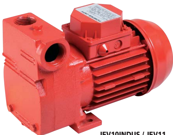
JEV10INDUS / JEV11