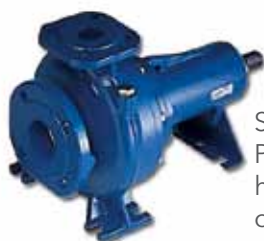
Série FHF Pompes horizontales sur châssis.

Débit jusqu'à 650 m 3 /h Hauteur de refoulement jusqu'à 100 m Température maximum du fluide pompé 140°C