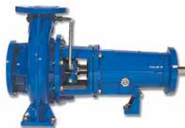
Série LS Pompes monocellulaires horizontales sur châssis.

Débit jusqu'à 240 m 3 /h Hauteur de refoulement jusqu'à 110 m Puissance jusqu'à 75 kW