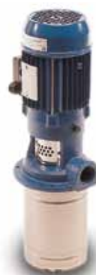
Série SVI Pompes multicellulaires verticales à hydraulique plongeante immergée.

Avec ses marques Lowara et Vogel, Xylem offre une large gamme de pompes multicellulaires de la série e-SV jusqu'à la série P et PVa avec différentes options de matériaux telles que la fonte, l'acier inoxydable et le bronze. Cette gamme de pompes inclut le système de pompes en tandem et des pompes à multiples orifices de refoulement utilisées en lutte anti-incendie.