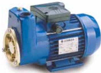
Série SP Pompes auto-amorçantes.

Débit jusqu'à 2,75 m 3 /h Hauteur de refoulement jusqu'à 49 m Puissance de 0,55 à 0,75 kW Hauteur d'aspiration jusqu'à 7 m