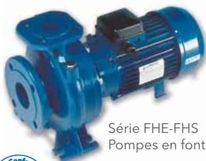
Série FHE-FHS Pompes en fonte.

Débit jusqu'à 4600 m 3 /h Hauteur de refoulement jusqu'à 170 m