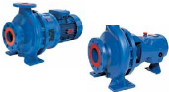
Série LSB-LSN Pompes horizontales monobloc (LSB) ou sur châssis (LSN), selon la norme ISO 2858 et ISO 5199 (LSN).

Débits jusqu'à 450 m 3 /h Hauteur de refoulement jusqu'à 150 m