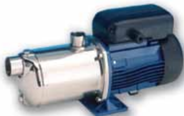
Série HM-HMS Pompes multicellulaires horizontales en acier inoxydable.

Débit jusqu'à 7,2 m 3 /h Hauteur de refoulement jusqu'à 60 m Puissance jusqu'à 0,9 kW Pompes HMS en AISI316