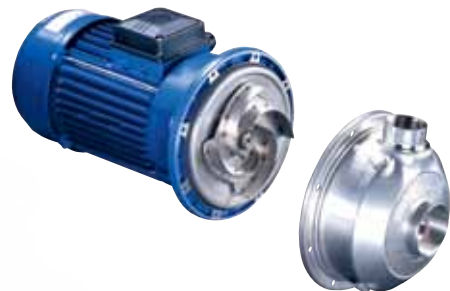
Série SHO Pompes horizontales en acier inoxydable AISI316 à roue ouverte.

Débit jusqu'à 54 m 3 /h Hauteur de refoulement jusqu'à 24 m Puissance jusqu'à 3 kW