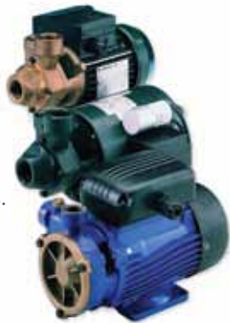
Série P-PB-PK Pompes périphériques.

Débit jusqu'à 2,75 m 3 /h Hauteur de refoulement jusqu'à 49 m Puissance de 0,55 à 0,75 kW Hauteur d'aspiration jusqu'à 7 m