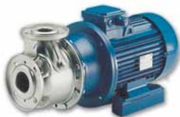
Série SHE-SHS-SHF Pompes en acier inoxydable AISI 316.

Débit jusqu'à 240 m 3 /h Hauteur de refoulement jusqu'à 110 m Puissance jusqu'à 75 kW