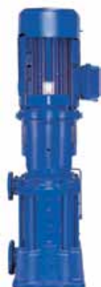
Série P-PVa Pompes multicellulaires horizontales (P) ou verticales (PVa).

Débits jusqu'à 1800 m 3 /h Hauteur de refoulement jusqu'à 300 m Température du fluide jusqu'à 140°C