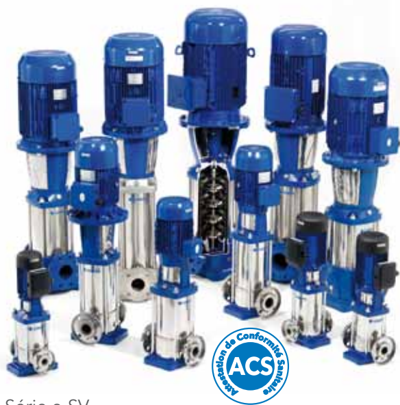
Série e-SV Pompes multicellulaires verticales.

Débit jusqu'à 160 m 3 /h Hauteur de refoulement jusqu'à 330 m Puissance jusqu'à 55 kW Température du fluide de -30°C jusqu'à 120 °C