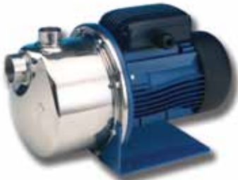
Série BG Pompes auto-amorçantes monobloc.

Débit jusqu'à 3,72 m 3 /h Hauteur de refoulement jusqu'à 82 m Puissance jusqu'à 1,1 kW