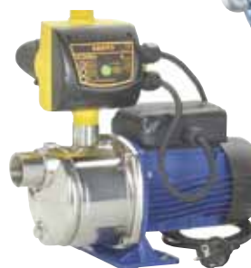
Groupes de surpression domestiques.

Séries SPHERE, BLOCK et RH60 Groupes de surpression pré-assemblés à partir de pompes Lowara. Ils sont équipés de pompes des séries BG, CEA, CA ou HM.