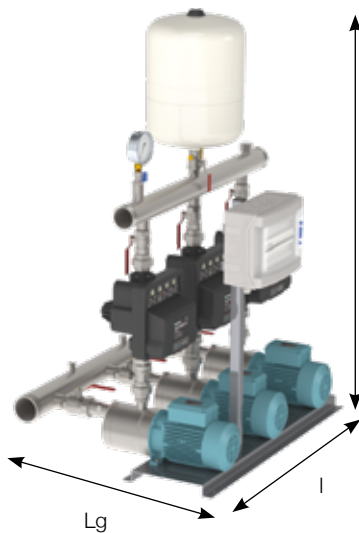
S30 V2TT MXH405