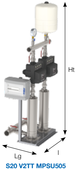
S20 V2TT MPSU505