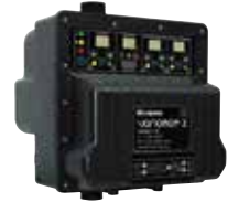
Système compact à variation de vitesse VARIOMAT2...TT

En complément de cette sélection de surpresseurs, de nombreux modèles sont également disponibles. Devis sur demande : devis@calpeda.fr