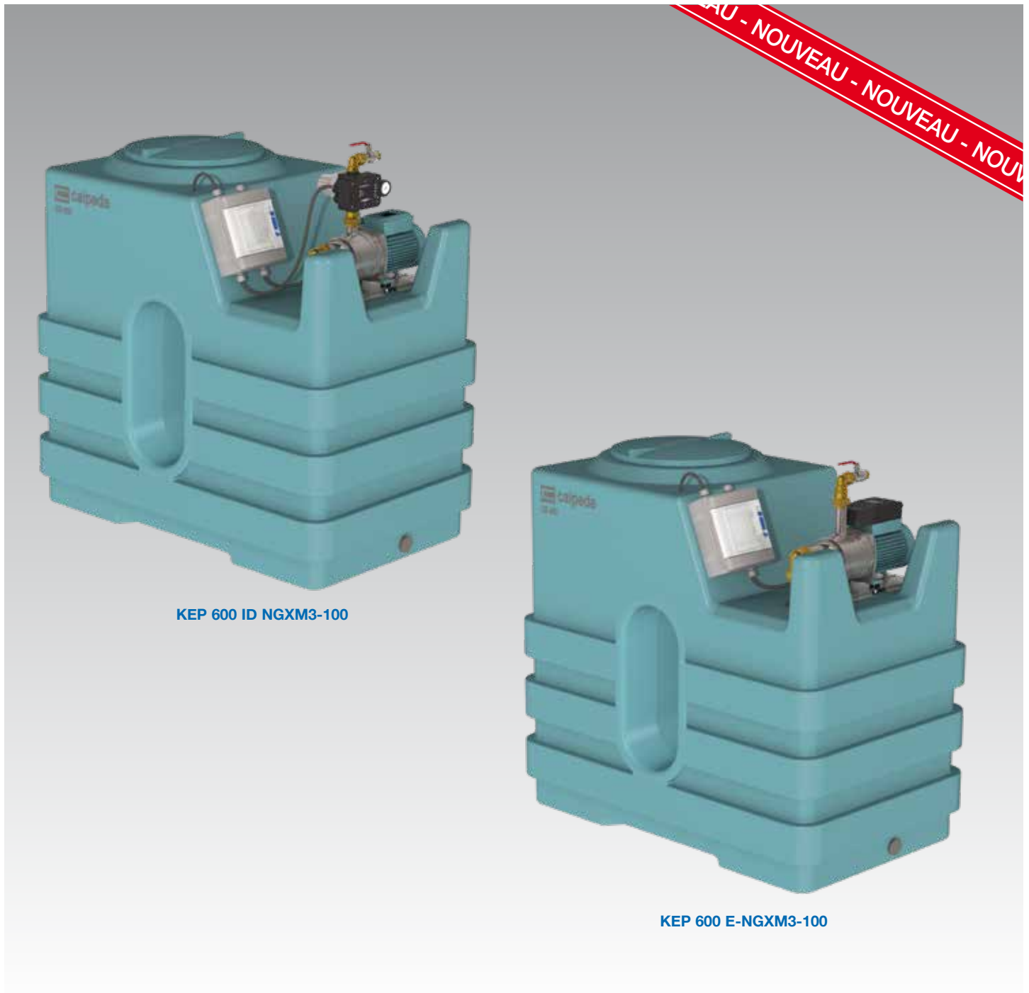
KEP 600 ID NGXM3-100