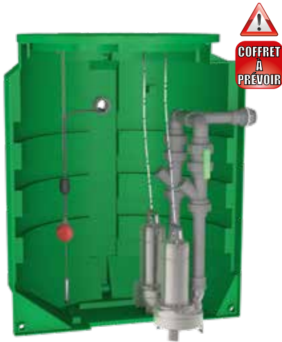
Volume de bâchée du poste (à régler sur site)

Poste livré avec 1 sonde piezo et 1 flotteur pour l'alarme trop-plein (10 m de câble).