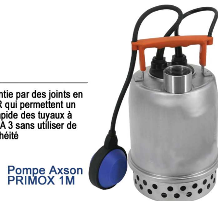
Pompe Axson PRIMOX 1M

Prédisposition pour vidange d'urgence en position basse (raccord fileté inclus)