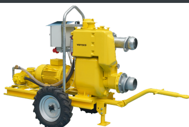
TROLLEY VAR SPL 6-350