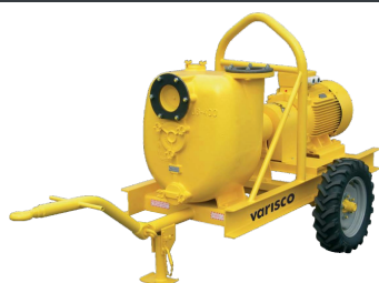
TROLLEY VAR 6-350