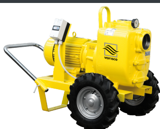
TROLLEY VAR 4-250