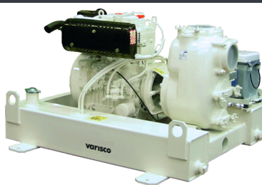
VAR 4-159 D BLOCK - E