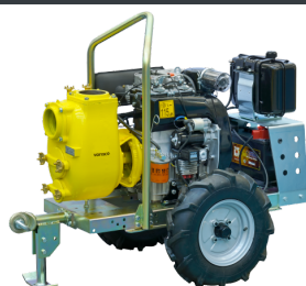
VAR 4-159 D TROLLEY - E