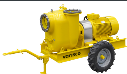
TROLLEY VAR 12-400