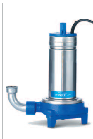
Installation semi mobile avec coude de refoulement.