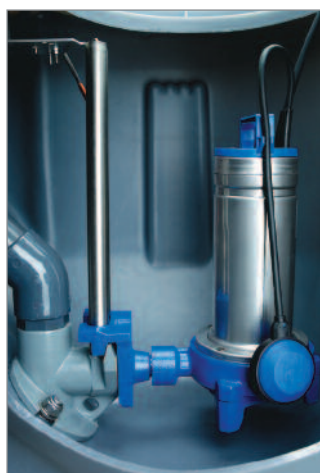
Installation fixe avec pied d'assise, barres de guidage et tuyauterie de refoulement. Montage dans une station Micro Flygt