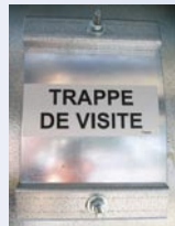
Trappe de visite + perçage d'évacuation sur le ventilateur