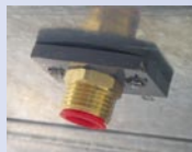
Bouchon purge fileté sur caisson