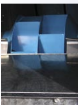
Roue à réaction