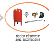
option réservoir avec automatisme

Les pictogrammes facilitent le choix des produits à partir de données généralisées. Toute configuration différente doit être étudiée de façon personnalisée