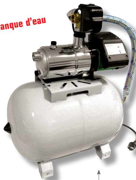
Réservoir de 50 litres à vessie interchangeable