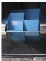
Roue à réaction