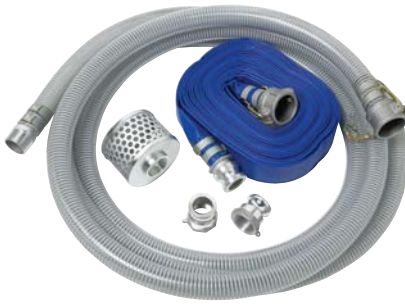
NÉCESSAIRE DE BOYAUX À RACCORDS CAMLOCK 2 po – PIÈCE NUMÉRO CB67023