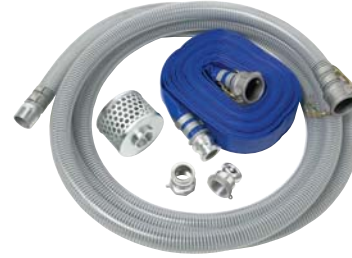
NÉCESSAIRE DE BOYAUX À RACCORDS CAMLOCK 1,5 po – PIÈCE NUMÉRO CB67025