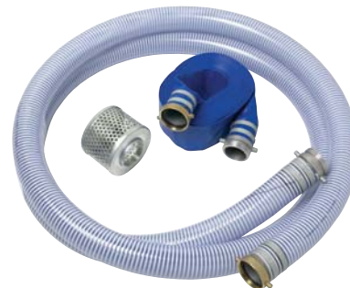
NÉCESSAIRE DE BOYAUX À RACCORDS À OREILLES 3 po – PIÈCE NUMÉRO CB67027