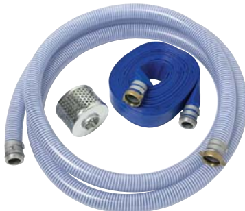
NÉCESSAIRE DE BOYAUX À RACCORDS À OREILLES 2 po – PIÈCE NUMÉRO CB67026