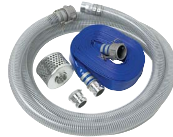
NÉCESSAIRE DE BOYAUX À RACCORDS CAMLOCK 3 po – PIÈCE NUMÉRO CB67024