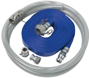
NÉCESSAIRE DE BOYAUX À RACCORDS CAMLOCK 1 po – PIÈCE NUMÉRO CB67022