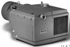
U 4.70 - U 4.630