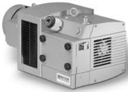
KDT 3.60 - KDT 3.140