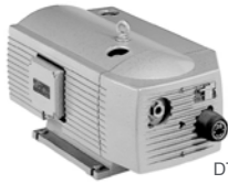
DT 4.10 - DT 4.40