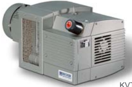
KVT 3.60 - KVT 3.140