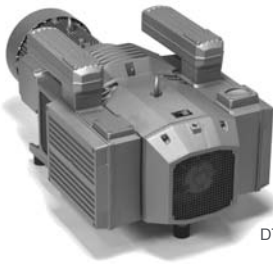
DTLF 200 - DTLF 500