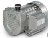
DT 4.4 - DT 4.8