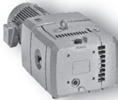
DP 2.100 - DP 2.140