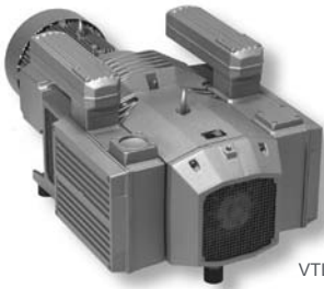
VTLF 200 - VTLF 500