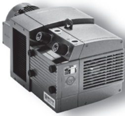
DVT 3.60 - DVT 3.140