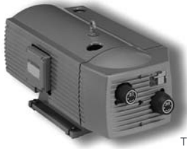
T 4.16 DV - T 4.40 DSK