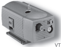
VT 4.10 - VT 4.40