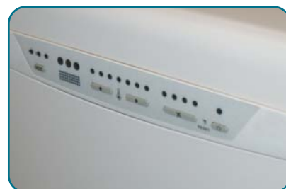
Platine de commande

ATTENTION : percer les trous diamètre 155 avec une légère inclinaison, afin de prévenir tout retour d'eau par les tubes.