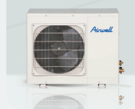
GC 18 N / NRC