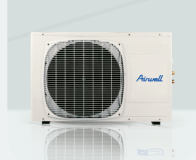
GC 24-30 / NRC