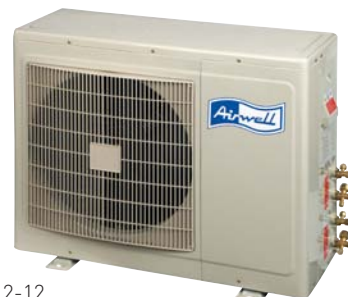
DUO 9-9 / 9-12 / 12-12

Equipés de compresseurs rotatifs garantissant faible consommation d'énergie et discrétion sonore, les groupes de condensation extérieurs Multisplits DUO sont traités avec le revêtement peinture poudre "High Density" qui leur assure une forte résistance quelles que soient les conditions de fonctionnement.