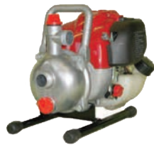
TEM 25 H