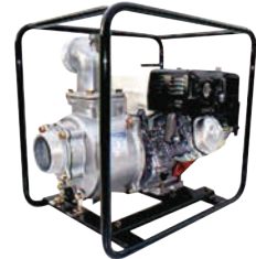
TE2 100 HA