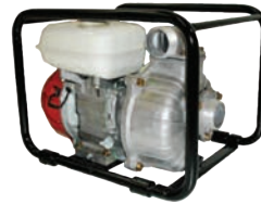
TET2 50 H