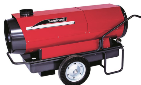
ITA 45 / 75 Robust