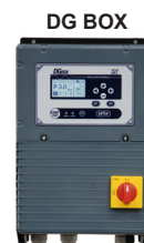
système de contrôle et protection avec variateur de vitesse.