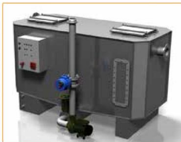
GGNS-P AVEC POMPE CENTRIFUGE Disponible sur les modèles : NS4, 6, 10, 15