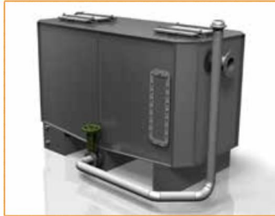
GGNS-C AVEC COLONNE DE VIDANGE Disponible sur les modèles : NS2, 4, 6, 10, 15