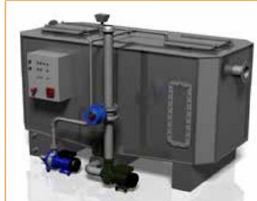
GGNS-W-P AVEC REMPLISSAGE ET POMPE CENTRIFUGE Disponible sur les modèles : NS4, 6, 10, 15

Toutes les dimensions sont en mm. Tous les dessins figurant dans cette brochure sont donnés à titre d'exemple et sous réserve de modifications. Pour obtenir les spécifications complètes et les derniers dessins des différents modèles, veuillez consulter www.greaseguardian.com ou contacter votre fournisseur local.