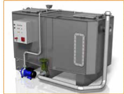
GGNS-C AVEC COLONNE DE VIDANGE ET DISPOSITIF DE REMPLISSAGE Disponible sur les modèles : NS4, 6, 10, 15