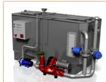
GGNS-W-PD-R AVEC REPLISSAGE, POMPE À DIAPHRAGME ET RECIRCULATION Disponible sur les modèles : NS6, 10, 15