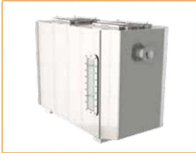
GGNS-B MODÈLE DE BASE Disponible sur les modèles : NS2, 4, 6, 10, 15