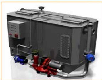
GGNS-W-PD AVEC REMPLISSAGE ET POMPE À DIAPHRAGME Disponible sur les modèles : NS6, 10, 15