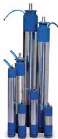
Séries L6W-L8W- L10W-L12W de moteurs rebobinables.