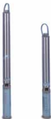
Série GS Pompe immergée de diamètre 4".

Débit jusqu'à 7,5 m 3 /h Hauteur de refoulement jusqu'à 80 m Puissance jusqu'à 1,1 kW Disponible avec régulateur de niveau incorporé